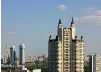
Жилой комплекс «Эдельвейс» г. Москва