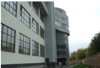
Торговый Дом «Народные художественные промыслы» г. Москва