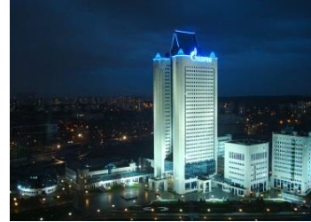
Data-центр ПАО «Газпром» г. Москва