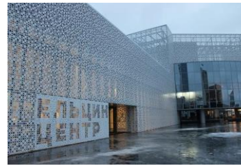
Ельцин центр г. Екатеринбург