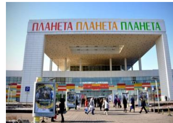
ТРЦ «Планета» г. Красноярск