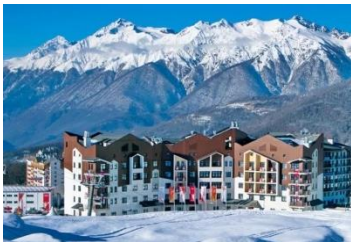
Гостиница на горнолыжном курорте «Роза Хутор» г. Сочи