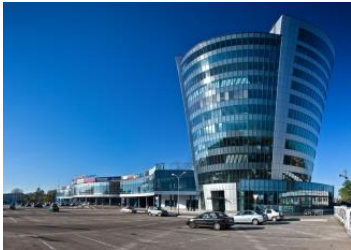
Бизнес-центр «Формат» г. Мытищи