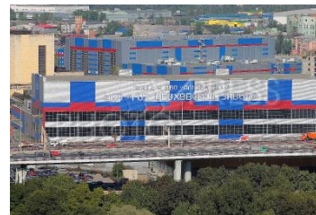
Завод ОАО «Концерн ПВО «Алмаз – Антей» в производственно-технологическом кластере «Северо-Западный региональный центр» г. Санкт-Петербург