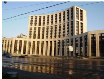
Международный инвестиционный банк г. Москва