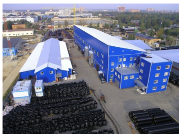
Климовский трубный завод г. Подольск