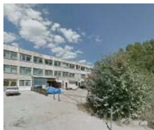
Калужский трубный завод г. Калуга