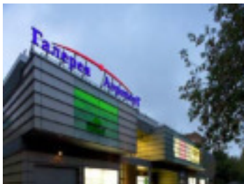
ТРЦ «Галерея Аэропорт» г. Москва