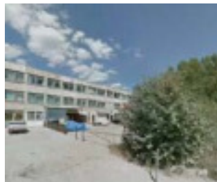
Калужский трубный завод г. Калуга