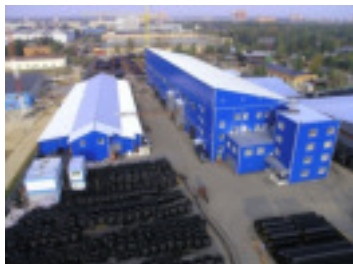
Климовский трубный завод г. Подольск