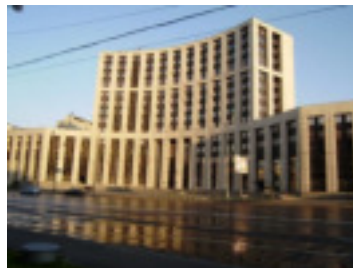
Международный инвестиционный банк г. Москва